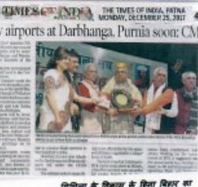
मिथिला के विकास के लिए विचार का